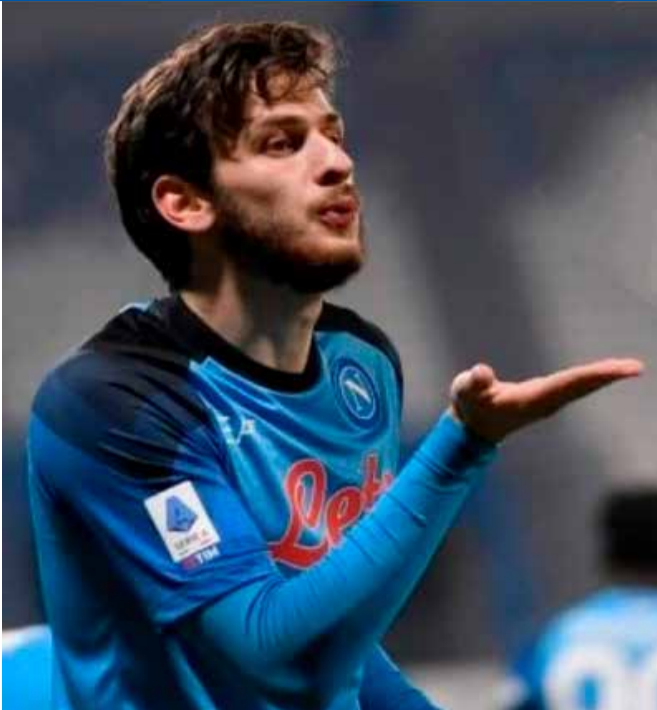
რიოზული განხილვის საგანი გახდა. სეზონის ბოლოს, კლოპი „ლივერპულიდან“ მიდის და დიდი შანსია, გუნდი სალაჰსაც დატოვოს. შესაბამისად, როცა სალაჰის

ისე, ინგლისური პრემიერლიგის გასულ ტურში, გუნდის ლიდერ მოჰამედ სალაჰსა და მთავარ მწვრთნელს, იურგენ კლოპს შორის შელაპარაკება მოხდა, რაც სე-