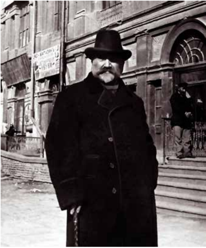
საც, განათლებული ვარო. იგი ყოველ გონებადახშულზედ უარესია.

შენყნარება დაჯერებას არ ჰნიშნავს, გინდა თუ არა, არამედ პატივსა, რომლითაც უნდა მოექცეთ სხვის აზრს, თუნდაც თქვენს უსიამოვნოს, თქვენს წინააღმდეგს. პატივით მოქცევა კიდევ იმას ჰქვია, რომ მთქმელს, თუ გამკითხველს საბუთი გაუჩხრეკოთ, საბუთი აუნონოთ თქვენს საკუთარ სასწორზე, ასე თუ ისე საკუთარი ფასი დასდოთ და მისანყავი ისე მიუწყათ. ყოველად საკადრისი საქციელი გონებაგახსნილისა და მართლა განათლებულის კაცისა სწორედ ეს გზაა და სხვა არაა. ვისაც ეს არა სჭირს, ტყუილად თავსა სდებს განათლებაზე, ტყუილად აბრიყვებს თავისთავსაც და სხვა-