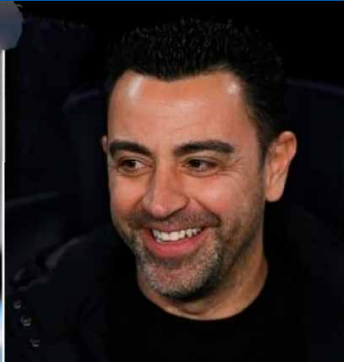
წასვლა ახსენეს, ჟურნალისტებმა მიანიშნეს, რომ ეგვიპტელის ადგილზე, იდეალური კანდიდატურა... ხვია კვარაცხელია იქნებოდა.