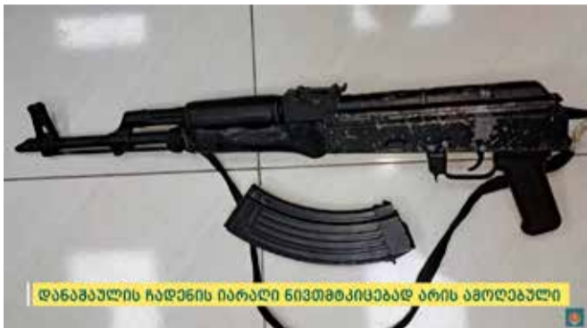
დანაშაულის ჩადენის იარაღი ნივთმტკიცებად არის ამოღებული